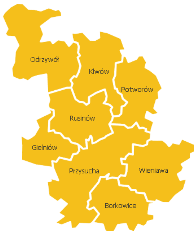
Mapa Powiatu Przysuskiego