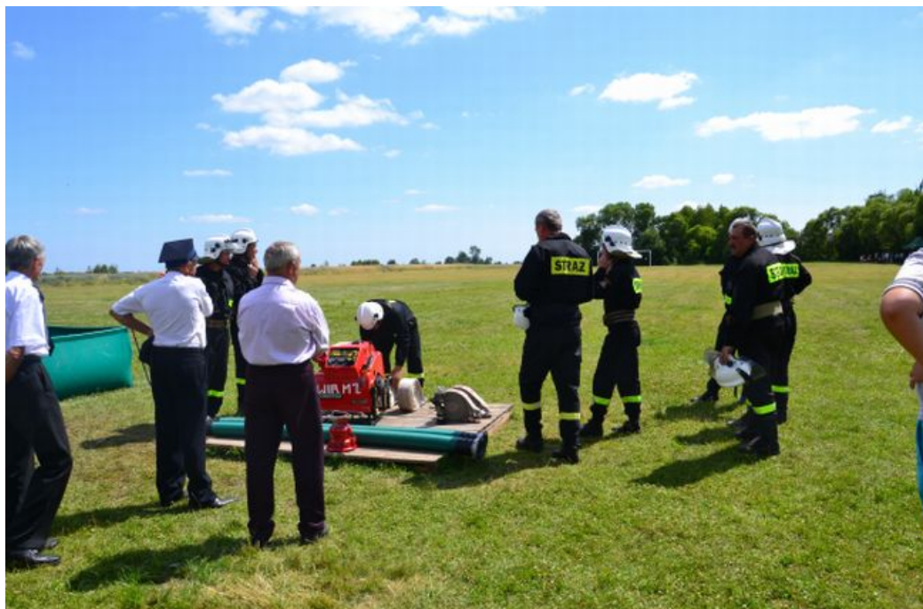
Fot. Gminne zawody sportowo- pożarnicze