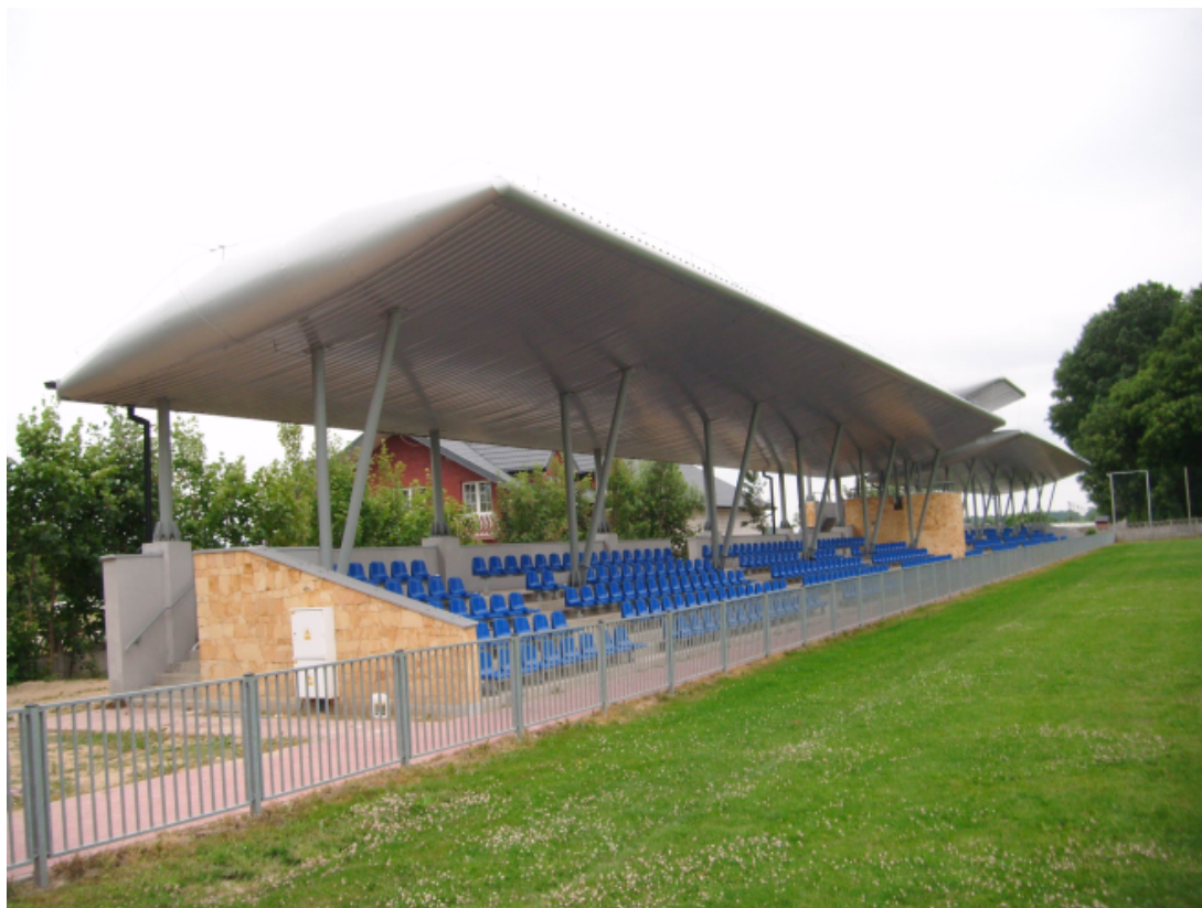
Fot. Nowoczesne trybuny zadaszeniem - Potworów

W Gminie funkcjonują także świetlice wiejskie, gdzie odbywają się liczne imprezy lokalne, spotkania kół gospodyń wiejskich, stowarzyszeń oraz prowadzone są zajęcia dla dzieci i młodzieży. Gmina pozyskała środki na modernizację świetlic wiejskich z Programu Rozwoju Obszarów Wiejskich 2007-013 w ramach działania „Odnowa i Rozwój Wsi” Dzięki wsparciu z funduszy europejskich udało się zmodernizować świetlice m.in. w Mokrzczu, Rdzowie, Grabowej i Kozińcu.