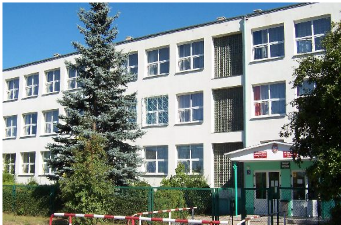
Fot. Budynek szkoły w Potworowie

Działalność kulturalna na terenie Gminy Potworów realizowana jest i koordynowana przez Gminną Bibliotekę Publiczną w Potworowie. Jest to samorządowa instytucja kultury – instytucja kultury posiadająca osobowość prawną, zajmująca się organizacją imprez artystycznych i rozrywkowych, przy współudziale z miejscowymi szkołami oraz młodzieżą. Na terenie gminy funkcjonuje również