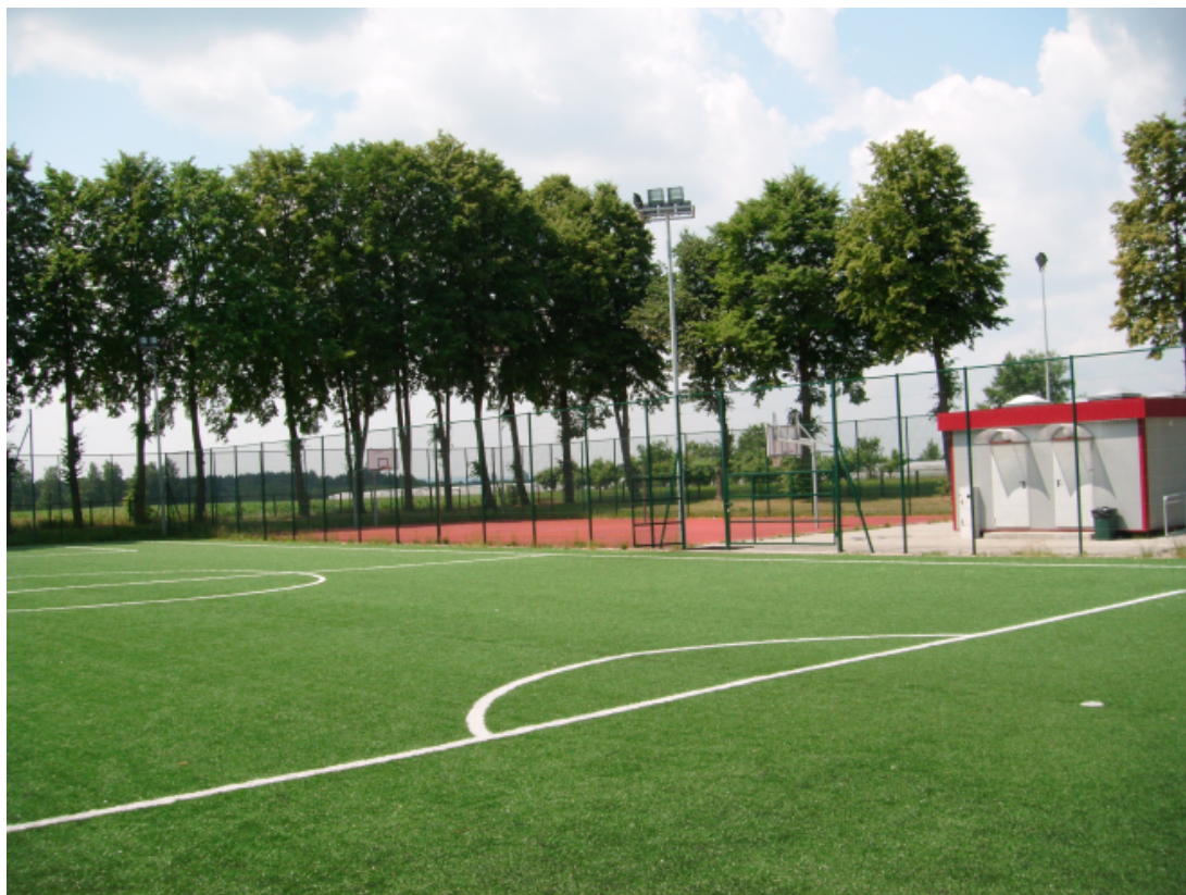
Fot. Boisko w Wirze