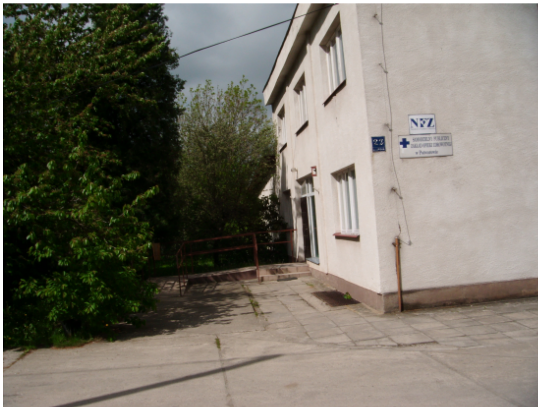
Fot. Budynek ośrodka zdrowia w Potworowie.