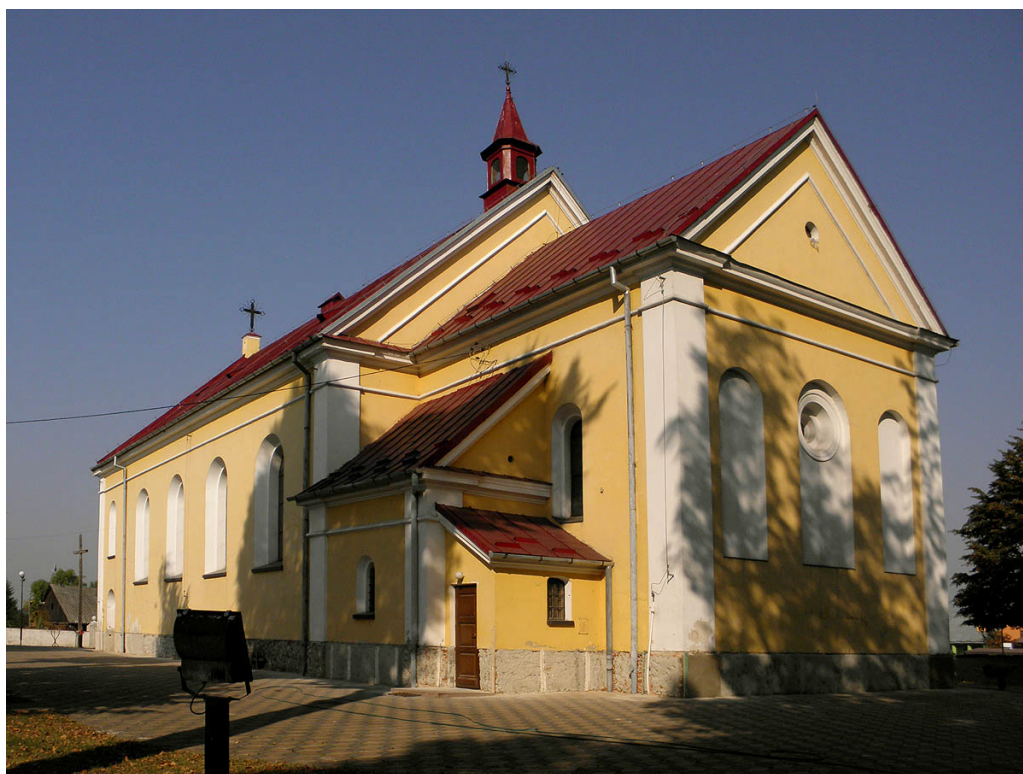
Fot. Zabytkowy kościół p.w św. Doroty w Potworowie

Gmina Potworów posiada dokument „Gminny Program opieki nad zabytkami na lata 2013-2016”, przyjęty uchwałą Rady Gminy, który ma pomóc w aktywnym zarządzaniu zasobem kulturowym gminy.