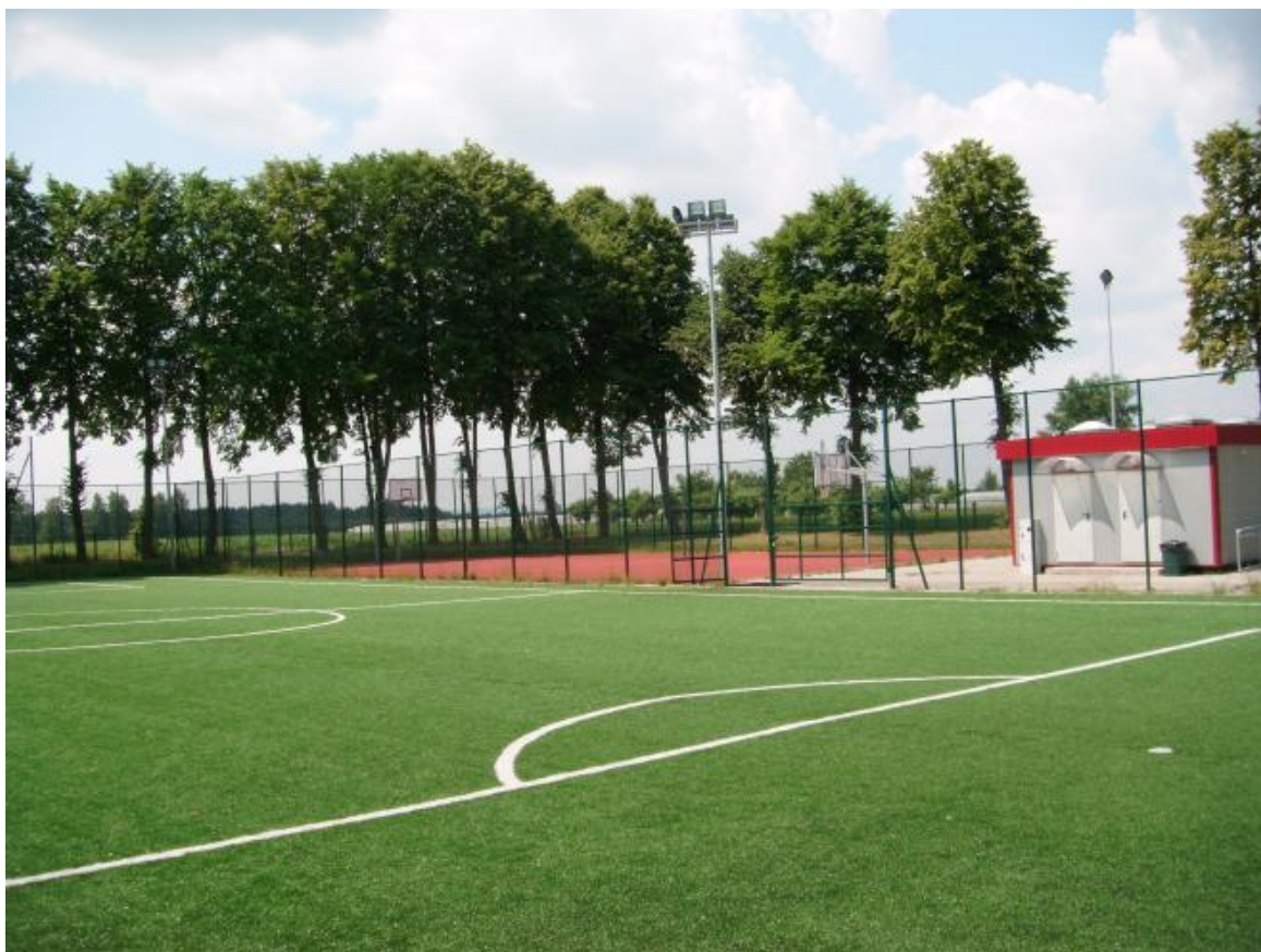
Fot. 3: Boisko sportowe w Wirze.

Poza zmodernizowanym stadionem w Potworowie władze mogą pochwalić się dwoma kompleksami boisk sportowych powstałych w ramach programu "Moje Boisko - Orlik 2012".