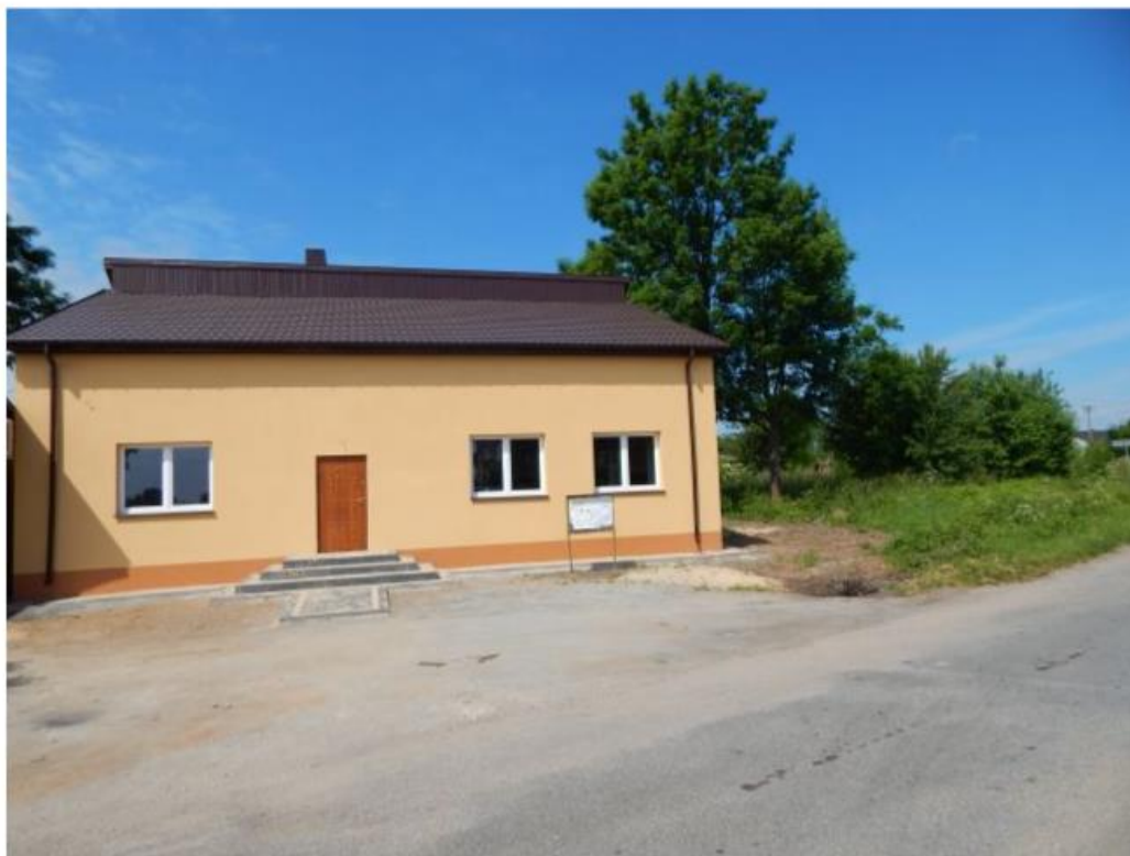
Fot. 6: Świetlica wiejska Rdzów

Budynek składa się z części świetlicy – sala główna z pomieszczeniami socjalnymi o powierzchni użytkowej 203,70 m 2 oraz garażu OSP o powierzchni 60,53m 2 . Wyposażenie świetlicy zostało ufundowane w ramach operacji w ramach poddziałania 19.2 „Wsparcie na wdrażanie operacji w ramach strategii rozwoju lokalnego kierowanego przez społeczność” z wyłączeniem projektów gruntowych oraz operacje w zakresie podejmowania działalności gospodarczej objętego Programem Rozwoju Obszarów Wiejskich na lata 2014 – 2020.