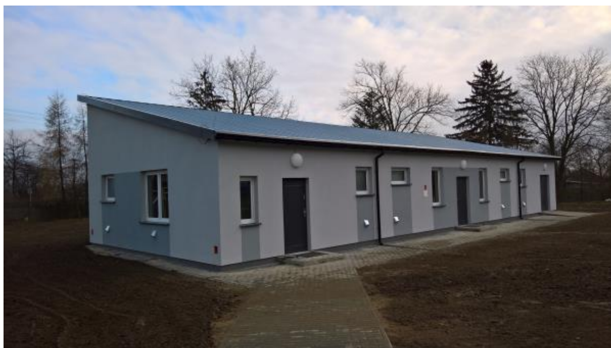
Fot. 5: Budynek socjalny przy gminny Stadionie Sportowym.