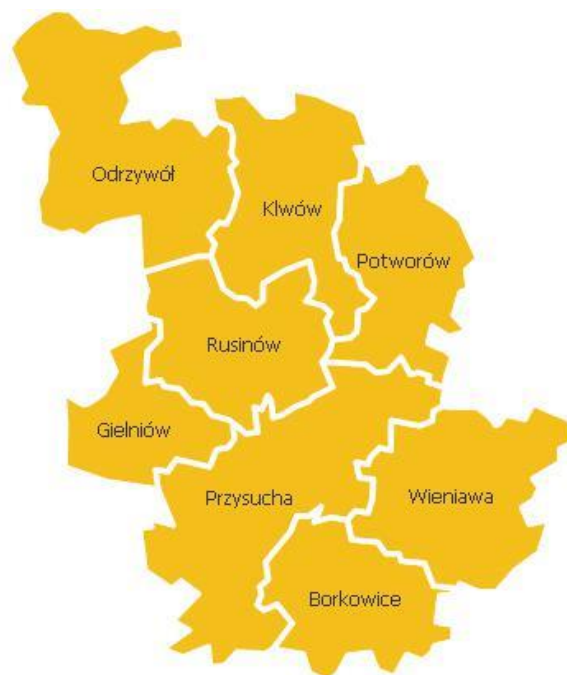
Rys. 1 Mapa powiatu przysuskiego Powiązania zewnętrzne:

Rdzów, Rdzuchów, Rdzuchów Kolonia, Sady, Wir.