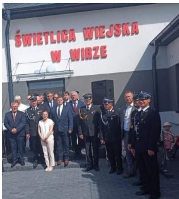
Fot. 8: Obchody Dnia Strażaka

W Gminie Potworów organizowane są wydarzenia mające na celu integrację środowisk lokalnych. W świetlicach organizowane są zajęcia edukacyjne i rekreacyjne dla dzieci oraz aktywności dla seniorów. Obiekty są wykorzystywane na potrzeby KGW działających na terenie miejscowości Gminy Potworów.