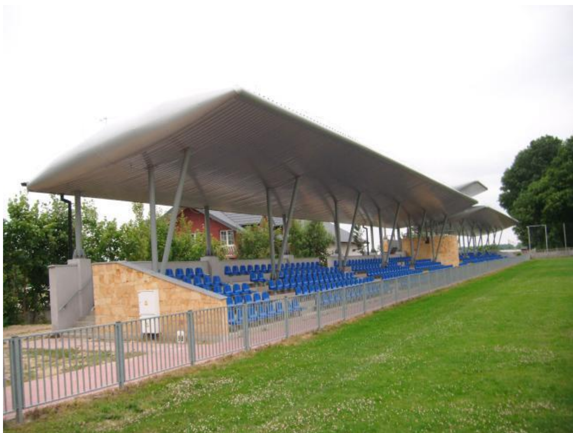
Fot. 4: Trybuny z zadaszeniem.