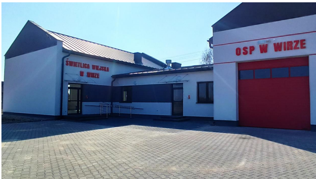
Fot. 7: Świetlica wiejska z garażem OSP w miejscowości Wir.

W Gminie Potworów organizowane są wydarzenia mające na celu integrację środowisk lokalnych. W świetlicach organizowane są zajęcia edukacyjne i rekreacyjne dla dzieci oraz aktywności dla seniorów. Obiekty są wykorzystywane na potrzeby KGW działających na terenie miejscowości Gminy Potworów.