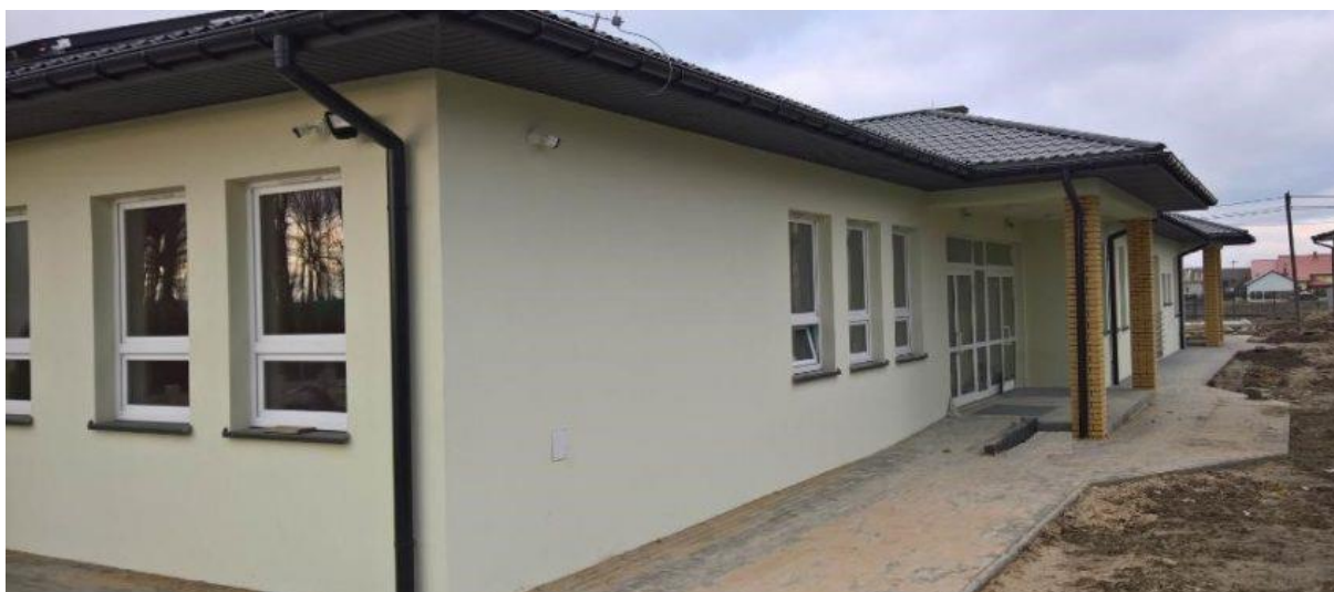
Fot. 10: Budynek Samodzielnego Publicznego Zakładu Opieki Zdrowotnej w Potworowie.

norm unijnych. Nowy obiekt powstał na działce obok starego Ośrodka, przy ulicy Lipowej. Na podstawie programu inwestorskiego wewnątrz nowego budynku powstał między innymi: punkt rejestracji, pomieszczenia poczekalni dla dorosłych i dla dzieci, gabinet pediatryczny połączony z pokojem szczepień, specjalistyczne gabinety internistyczne, w tym jeden zespolony z pomieszczeniem przeznaczonym do badań EKG. Ważne, że poczekalnie są rozdzielone: osobne dla dzieci chorych i drugie, dla dzieci zdrowych.