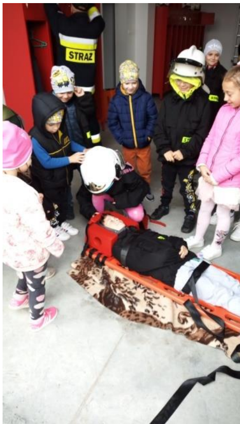
Fot. 9: Dzień Dziecka aktywnie

Samochód średniej wielkości z napędem 4x4 dla prowadzenia działań ratowniczo-gaśniczych trafił do jednostki Ochotniczej Straży Pożarnej w Potworowie. Wartość samochodu to 900 360,00 złotych. Zakup został współfinansowany z dotacji w wysokości 100 000,00 zł otrzymanej od Województwa Mazowieckiego oraz z dofinansowania Ministerstwa Spraw Wewnętrznych i Administracji w wysokości 475 000,00 zł.