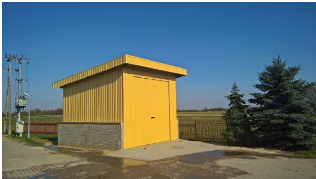
Fot. 11 Budynek magazynowy na terenie gminnej Oczyszczalni Ścieków w Grabowej.

W 2017 roku został wybudowany budynek magazynowy na oczyszczalni ścieków w Grabowej, który wykorzystywany jest m. In. do przechowywania osadu ściekowego.