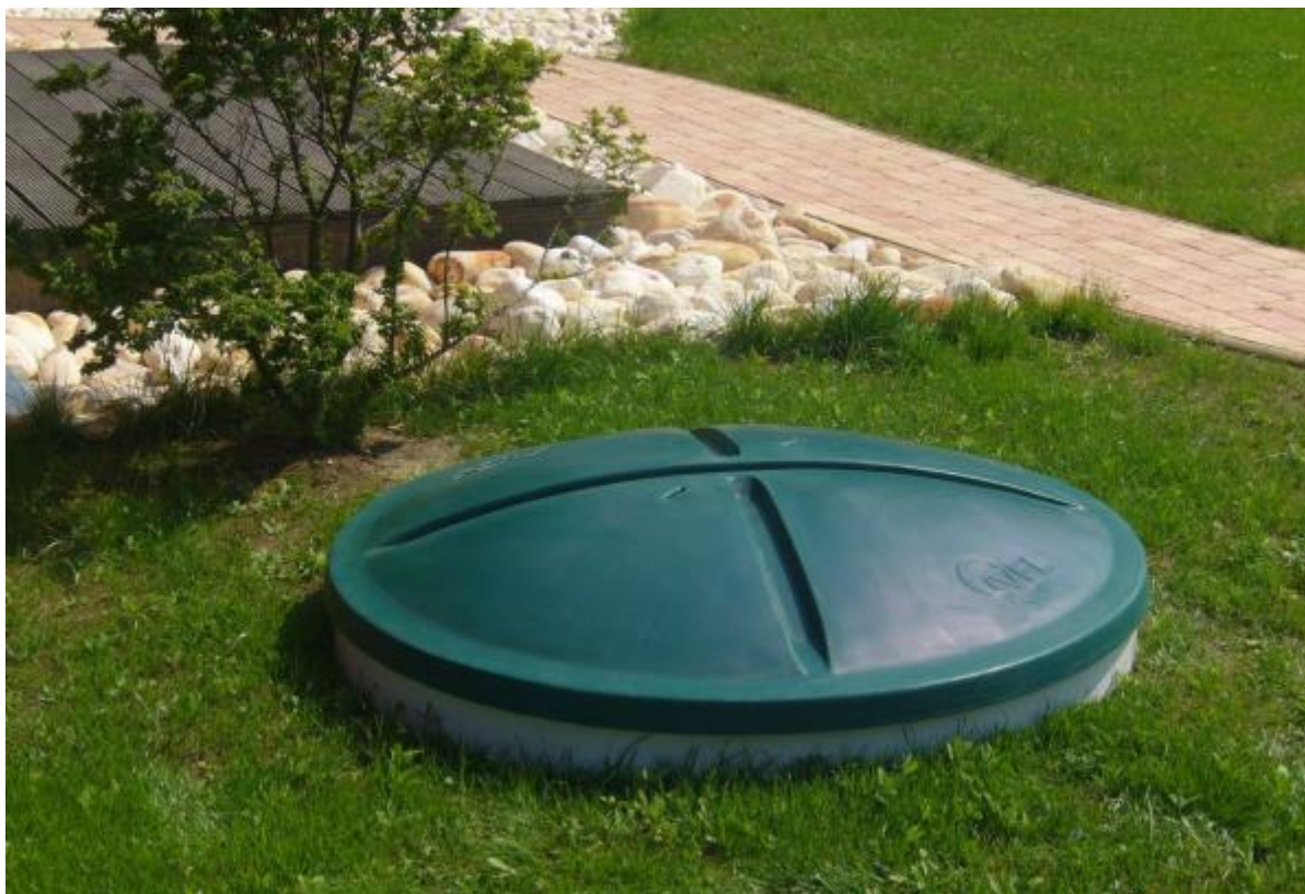
Fot. 12: Przydomowa Oczyszczalnia Ścieków.

Przydomowe biologiczne oczyszczalnie ścieków spełniają rygorystyczne wymogi normy jakościowej PN-EN 12566-3+A2:2013 i posiadają znak CE wraz z infrastrukturą niezbędną do ich prawidłowego funkcjonowania.